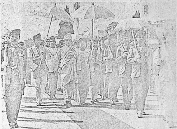
■TIMBALAN Yang Dipertuan Agung sedang dititipi ke Bangunan Parlimen untuk merasmikan pembukaan penggal keempat sidang Parlimen di Kuala Lumpur semalam.

Turut sama dalam perwakilian ini ialah ahli-ahli persatuan itu dari New Zealand, Sri Lanka, United Kingdom, Singapura, Fiji, Canada dan New South Wales.