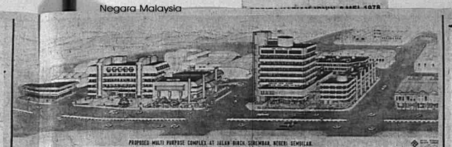
PROPOSED MULTI PHASE COMPLEX AT JALAN BESAR, SEREMBAN

Sementara itu Dr. Mahathir dalam ucapannya pula berkata Ke-