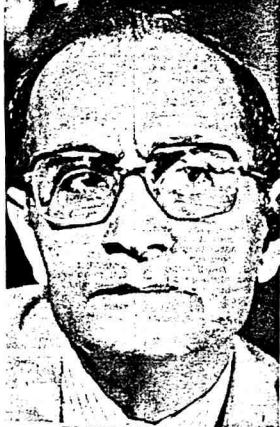
■ DATUK HUSSEIN ONN

Pengiktirafan sedemikian, sudah tentu dibuat secara ilmiah menggambarkan betapa prosasnya pelaburan asing di negara ini sejak 1978, apabila seminar pelaburan luar negeri mula diperhebatkan. Mengemang sudah menjadi kenyataan bahawa kadar perdagangan dan pelaburan di Malaysia mula memasuki era kebangkitan sejak awal tahun-tahun 70an lagi.