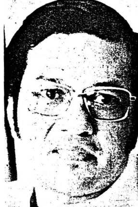
■ DATUK SERI DR. MAHATHIR

Sabotaj Pemimpin negara, termasuk Perdana Menteri Datuk Hussein Onn, Datuk Seri Dr. Mahathir, Datuk Musa Hitam, Datuk Seri Hamzah Abu Samah, Datuk Amar Haji Abdul Taib Mahmud, Datuk Paul Leong, Tengku Ahmad Rithauddeen serta lain-lainnya memainkan peranan positif dalam menarik lebih banyak modal asing ke Malaysia untuk mempercepat lagi proses perindustrian negara, untuk mewujudkan hubungan dagang secara terus menerus antara Kerajaan dengan Kerajaan dan antara pihak swasta tempatan dengan rakan mereka di luar negeri □