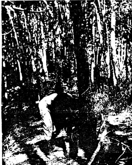
■ DARI titisan pohon getah inilah menjadikan Malaysia terkenal seluruh dunia kerana ia menjadi pembekal getah asli utama.

Kestabilan Usaha Petronas menaja minyak keluaran tempatan untuk penggunaan dalam negara membawa makna yang besar terhadap kestabilan ekonomi dan perdagangan serta perindustrian negara kerana krisis minyak yang sedang mengancam negara-negara perindustrian besar sudah ke negara ini. Inilah juga salah satu faktor yang mungkin menarik minat pemodal asing untuk datang ke Malaysia kerana di samping tenaga kerja yang cukup, Malaysia juga mempunyai sumber minyak yang terjamin. Kegiatan perdagangan dan perindustrian dalam negeri merupakan kegiatan aktif dan serius. Pergerakan Bumiputera dalam sektor perdagangan, eksport import dan pelaburan modal