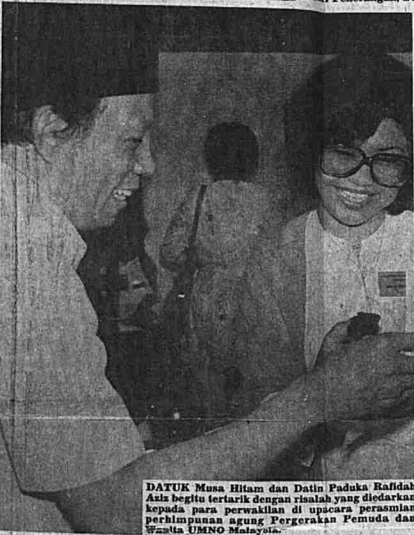
DATUK Musa Hitam dan Datin Paduka Rafidah Aziz begitu tertarik dengan risalah yang didedarkan kepada para perwakilan di upacara perasmian perhimpunan agung Pergerakan Pemuda dan Wanita UMNO Malaysia.