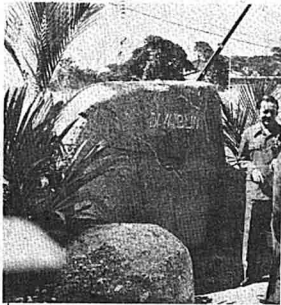
KEPEJALAN batu-batu besar ini melemahkan kejituan semangat Malaysia untuk terus membangun, maju dan tampli setaraf dengan negara-negara maju di dunia.

Alam persekitaran yang tidak segar dan tidak teratur bukan sahaja melemahkan daya pengeluaran masyarakat, tetapi juga bahu menambatkan lagi penyakit sosial seperti jenayah, penyalahgunaan dadah, kebebasan yang boleh meruntuhkan moral dan sebagainya.