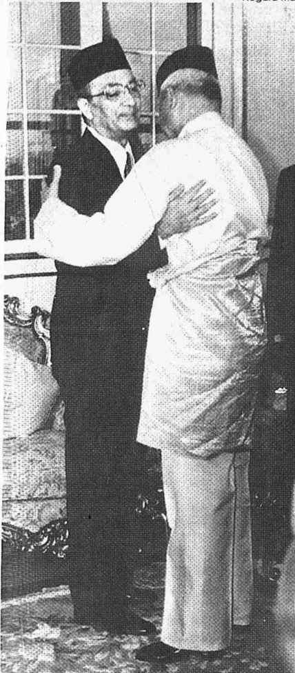
■ MENJADI adat dunia, setiap pertemuan akan berakhir dengan perpisahan dan setiap perpisahan pula dilirangi dengan perasaan pilu dan sedih. Seri Paduka dan Tun Hussein berpeluk-pelukan di saat akhir perpisahan selepas Seri Paduka menganugerahkan Darjah Seri Maharaja Mangu Negara (SMN) kepada bekas Perdana Menteri semalam.