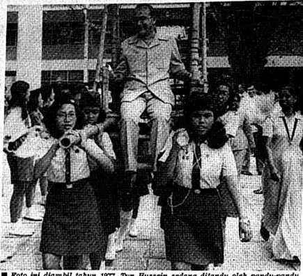
■ Foto ini diambil tahun 1977. Tun Hussein sedang ditandu oleh pandu-pandu puteri dari Sekolah Sultan Idris setibanya untuk merasmikan Jambori.