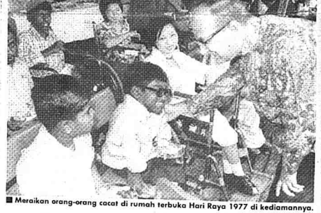
Meraikan orang-orang cacat di rumah terbuka Hari Raya 1977 di kediamannya.