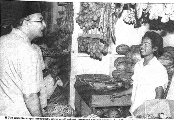
Tun Hussein sangat mengambil berat nasib rakyat, terutama peniaga-peniaga kecil Bumiputera.