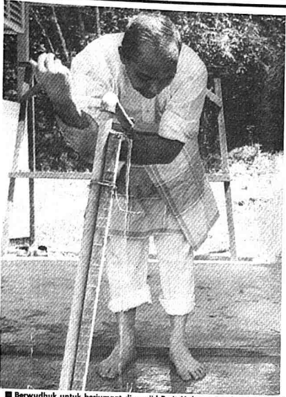
■ Berwuduk untuk berjumpa di masjid Parit Mahang, B.Pohar (Jun 1978).