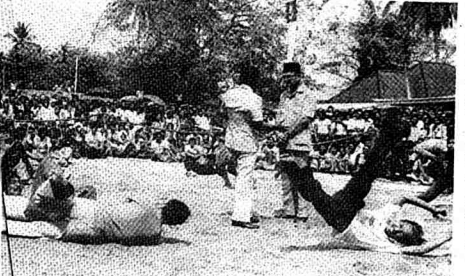
■ Tun Hussein diberi penghormatan menguji seni mempertahankan diri Nasrul Hq di Rumah Nasrul Haq di Kuala Lumpur dalam tahun 1978.

MHANDARDKAN rakaman foto seakhir-akhir ini, nampaknya Tun Hussein Onn begitu berat meninggalkan kabinet yang dipimpinya sejak berapa tahun lalu.