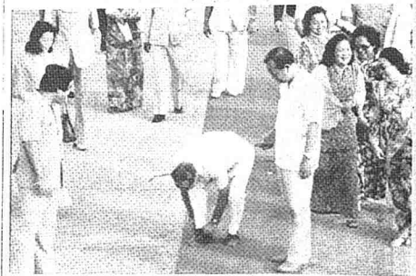
Tun Hussein membetulkan kasutnya dalam suatu lawatan (Mac 1980).