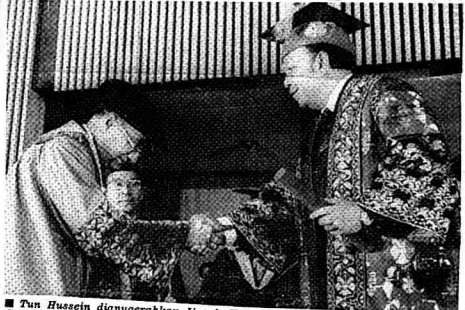
■ Tun Hussein dianggerahkan Hajah Keheormat Doktor Undang-undang oleh Canselor Universiti Kebangsaan, Tuanku Jaafar dalam tahun 1976.