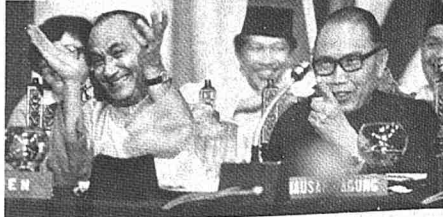
BAGI pemimpin yang menganggap kuasa adalah "amanah dan tanggungjawab", saat-saat akhir berpindah kuasa tidak sedikit pun menampilkan risu dan kecewa. Begitu halnya dengan Tun Hussein Onn dirakam dalam foto foto ini di Pesta Agung UMNO ke-32 akhir bulan lalu. Di persidangan itu dengan rasi beliau tidak lagi jadi Presiden UMNO, namun bersama Datuk Seri Dr. Mahathir dan pemimpin M1 lain, Tun Hussein berkecimpung saat-saat gembira. ■