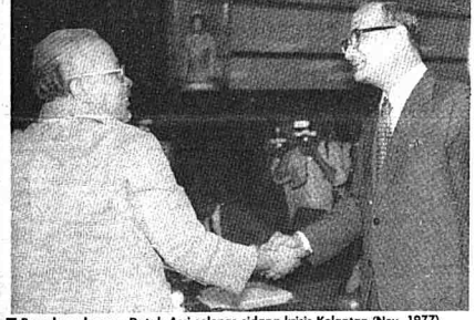
■ Bersalam dengan Datuk Atri selepas sidang krisis Kelantan (Nov. 1977).