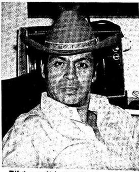
■ "Setiap penerbit harus pemikir..."

Dia sungguh kagum mendapati setengah negara kenakan undang2 ketat terhadap pengusaha.