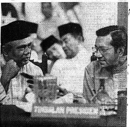
■PRESIDEN UMNO yang baru, Datuk Seri Dr. Mahathir Mohamad dan Naib Presiden, Encik Abdul Ghaffar Baba sedang membincangkan sesuatu.