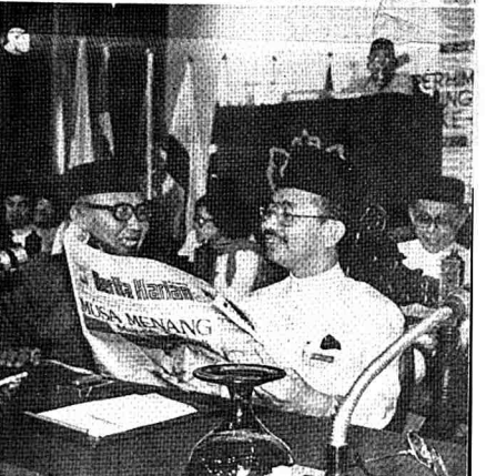
■TENGGU Razaleigh Hamzah tersenyum saja membaca akhbar yang melaporkan beliau terus dalam pemilihan Timbalan Presiden UMNO. Manakala, Senator Datuk Mustafa Jabar di sebelahnya juga tersenyum.