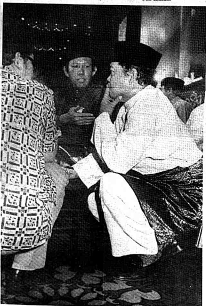
■DATUK Mohamad Rahmat begitu serius sekali mendengar pesanan Datuk Musa Hitam.