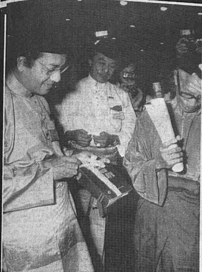
"Terimalah sejarah ini..." PRESIDEN UMNO, Datuk Seri Dr. Mahathir Mohamad (kiri), tersenyum sewaktu dihadiahkan sebuah buku mengenai perjuangan UMNO, di Kuala Lumpur semalam.