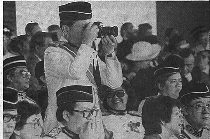
□ MENTERI Pelajaran Datuk Dr. Sulaiman Daud merakamkan istiadat tersebut dengan kameranya.