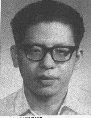
■ ENCIK LIM KIT SIANG