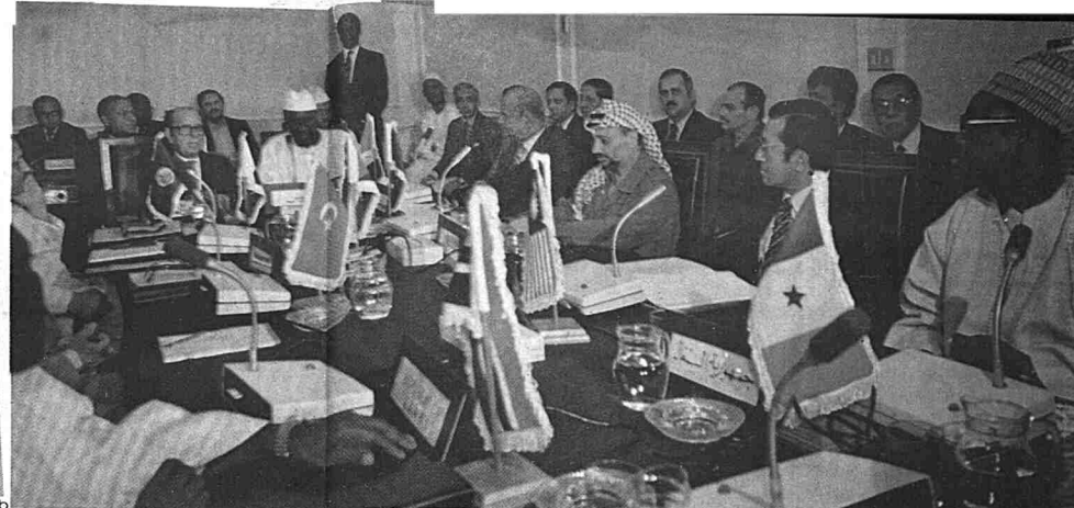
DATUK SERI DR. MAHATHIR MENGHADIRI SIDANG PERUBAHAN PERSIDANGAN ISLAM.

Ketegasan Pengumuman Universiti Islam itu bukan sahaja membuktikan kesungguhan beliau menghayati nilai-nilai keislaman, bahkan menunjukkan ketegasan seorang pemimpin. Apakah tidaknya, pengumuman universiti itu dibuat tatkala pilihanraya menjelang tiba sedangkan ia Universiti Merdeka belum lagi dibekalkan. Ramai ka itu meramalkan sesuatu politik ketikanya yang mendebarkan. Bagaimanapun dugaan itu tidak tepat kerana semua pihak termasuk parti pembangkang mengulangi tujuan yang sama. Bahkan pihak-pihak yang berkepentingan dengan Universiti Merdeka juga tidak bersuara kerana mereka juga memahami apakah hasrat sebenar pemimpin negara itu. Bagi setengah pihak melihat pengumuman itu sebagai satu kemenangan pilihanraya.