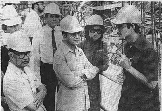
Perdana Menteri melawat projek Dayabumi di Jalan Hishamuddin, Kuala Lumpur baru-baru ini.