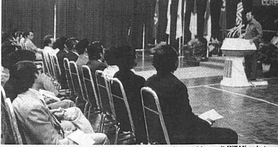
● DATUK Seri Dr. Mahathir merasmikan semiaran pegawai-pegawai kanan di INTAN pada tahun 1977.

satu usaha yang emas, cekap dan tinggi daya pengelirahan untuk mencapai kejayaan pesat dalam masa yang singkat-singkatnya. Inilah yang merupakan inti-pati dasar "Pandang ke Timur" itu, kerana negara-negara tersebut telah membuktikan kejayaannya, masih dinamik dan belum nampak tanda-tanda