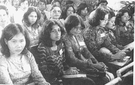
● SEBAHAGIAN peserta yang mengikuti kursus INTAN pada tahun 1978.