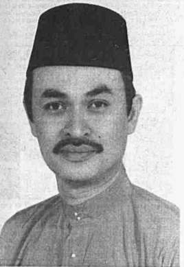
DATUK ABDULLAH AHMAD BADAWI

"INTAN telah memberi suatu sumbangan besar ke arah meningkatkan kecakapan dan daya pengelirahan dalam perkhidmatan awam. INTAN telah berkembang daripada sebuah institusi kecil kepada sebuah yang besar sebagai satu 'response' kepada keperluan latihan untuk pegawai dan kakitangan kerajaan.