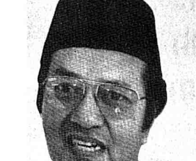
■ DATUK SERI DR. MAHAHIR

Permasalahannya dengan universiti lain di tanah air, kita ialah dari segi 'penghasilan' Segala pelajaran yang dikaji akan dijalankan dengan asas-asas Islam yang dapat dimengertikan bahawa Islam bukanlah agama yang semata-mata menjadi utas, tetapi adalah jalinan antara dunia dan akhirat.