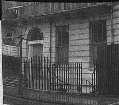
Dewan Malaysia di London. Di sinilah pelajar kita bertemu untuk mendapatkan berita-berita dari tanahair

Jadi, dari segi kesan, golongan aktivis lebih berjaya. □ Majalah-majalah yang diterbitkan dan diwariskan tapi usahanya LUMS serta Gabungan Pelajar Malaysia dan Singapura, nampaknya, lebih berkesan kerana mereka membuat majalah mereka di tangkai Dewan Malaysia. □ Majalah-majalah