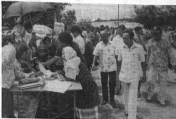
● TIMBALAN Perdana Menteri, Datuk Musa Hitam melawat pusat pemuangan undi kawasan Parlimen Damansara di Sekolah Sri Pantai, Kuala Lumpur semalam.

Antara Menteri Kabinet yang mengundi ialah Datuk Mohamed Rahmat di Sekolah Agama Kampung Padir, Tampoi. Beliau seperti pengundi lain berbarisan hanya dapat