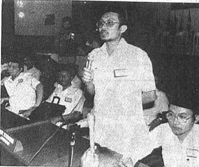
● BERUCAP selepas kemenangan