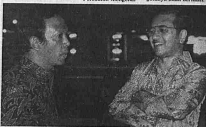
■ PERDANA Menteri, Datuk Seri Dr. Mahathir Mohamad (kanan) tersenyum mengendongkan sesuatu dari Timbalannya, Datuk Musa Hitam.