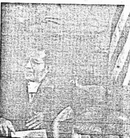
DUA pemimpin negara yang menjadi nod kepada pentadbiran 25M yang mengup angin baru ke arah kemajuan dan kemakmuran rakyat.

Uraian yang menyatupadukan rakyat berbilang kaum di negara ini dipikul oleh Tun Hussein Onn. Se- jarah himan 1969 tidak harus dilupai di mengadakan perub- ahan-perubahan baru yang lebih sesuai. Kalu Tun Abdul lahman terkenal dengan gelaran Bapa