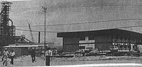
SEBAHAGIAN dari projek industri gas Sabah dalam pembinaan.

Lima tempat baru dibangunkan termasuk di pusat perindustrian Rantau-Rancha, Pohon Batu dan perkampungan baru Layang-Layangan, 15 kilometer dari pusat bandar.