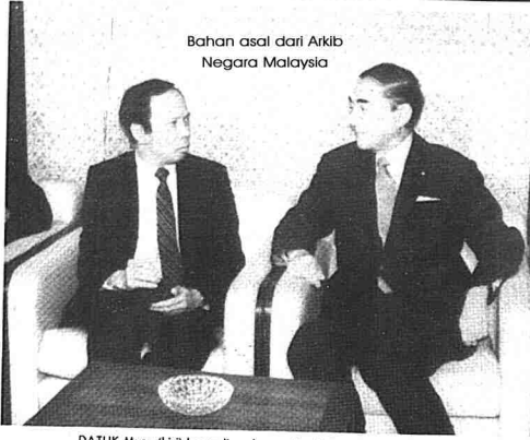
DATUK Musa (kiri) berunding dengan Perdana Menteri, Enck Yasuhiro Nakasone

Walaupun Jepun menunjukkan kemampuan membangunkan negaranya, namun Malaysia kurang menumpukan perhatiannya terhadap kejayaannya itu sehingga apabila Datuk Seri Dr Mahathir Mohamed memperkenalkan dasar Pandang Ke Timur.