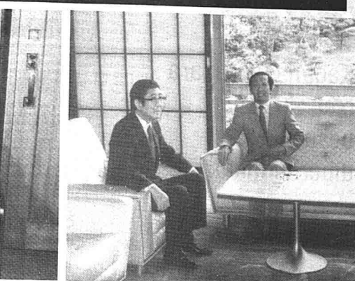
DATUK Musa (kanan) berunding dengan Menteri Luar Jepun, Enck Shintaro Abe