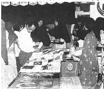
KESEKAPAN pengunjung memilih buku yang dipamerkan oleh Pekim