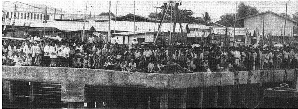
● Penduduk Kuala Kedah keluar beramai-ramai di jeti untuk menyaksikan perarakan bot yang membawa Perdana Menteri ke Seberang Kota.