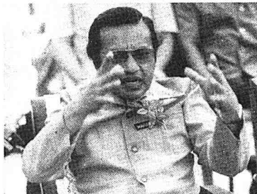
● Perdana Menteri berharap pekan Kuala Kedah akan mempunyai bangunan lebih indah dan menarik.