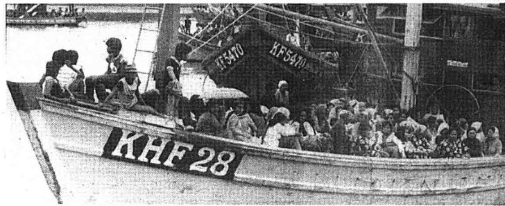
● Penduduk tempatan turut serta mengikuti perarakan ke Seberang Kota.