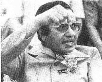
● Saya seronok bila balik ke sini. Rasa seperti kita cakup dalam keluarga.