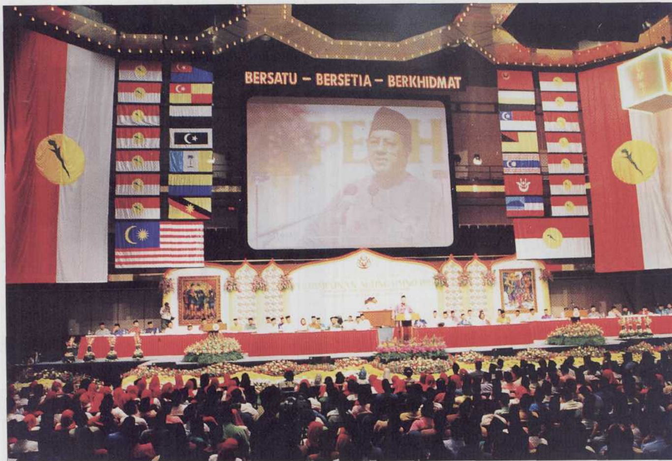
Suasana dalam Perhimpunan Agung UMNO, Pusat Dagangan Dunia Putra, Kuala Lumpur.