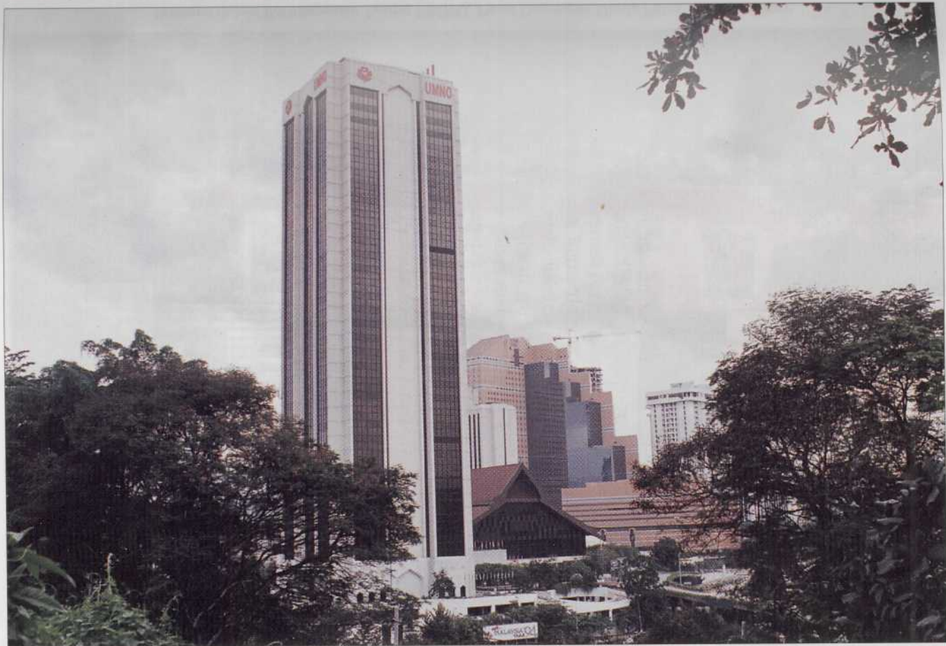
Bangunan Ibu Pejabat UMNO, Kuala Lumpur.