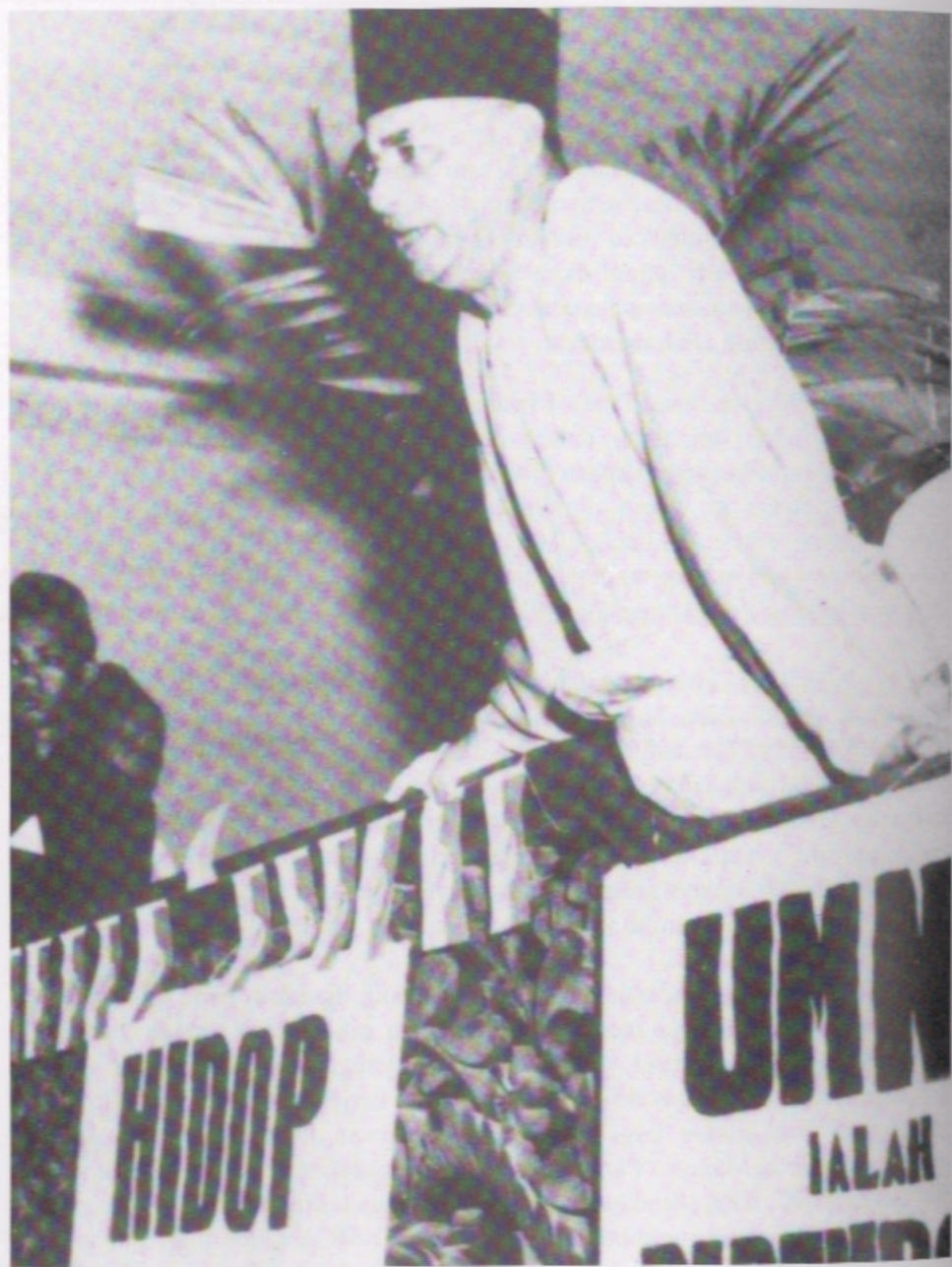
Dato' Onn Jaafar