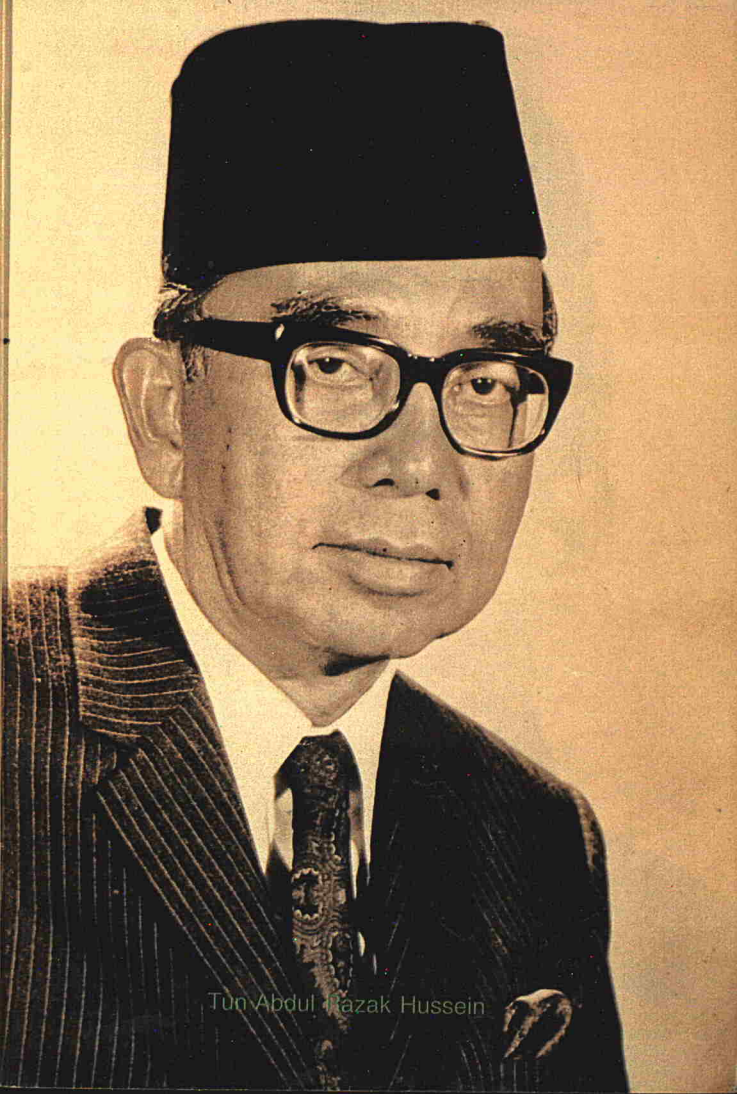
Tun Abdul Razak Hussein