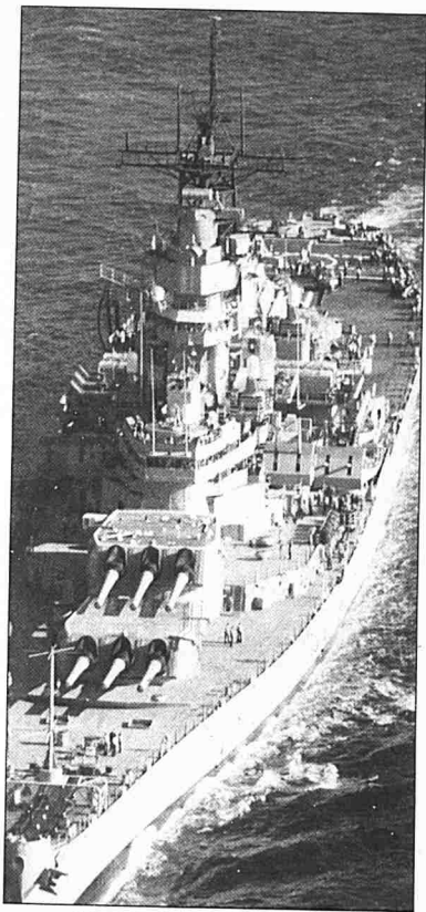
Sebuah kapal perang di lautan

India, dan pada abad ke-18 pula, KHTI memonopoli perdagangan teh di China.