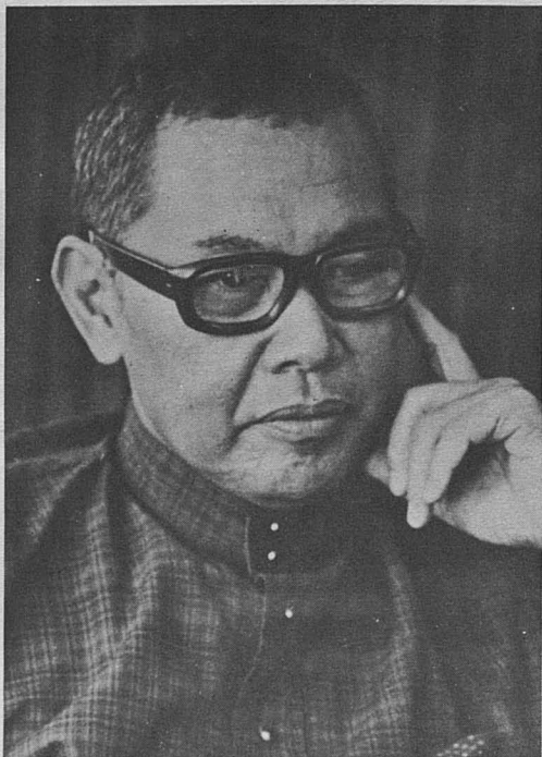
Tan Sri Ghazali Shafie, Menteri Halehwal Dalam Negeri