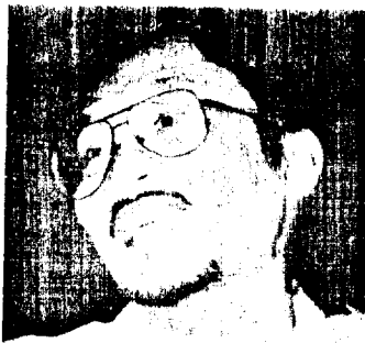
Anwar Ibrahim - Berperinsip dan teguh dengan pegangan Islam.

Seorang menamatkan projek Dayabumi adalah membazir, tetapi bangunan-bangunan yang