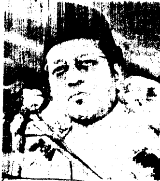
Datuk Seri Dr. Mahathir - seorang yang tegas dan berdisiplin.

"PM mahu orang-orang Melayu bekerja dengan penuh disiplin, disikasikan membangunkan negara Malaysia. Bukankah mudah menukarkan corak bekerja begitu..."