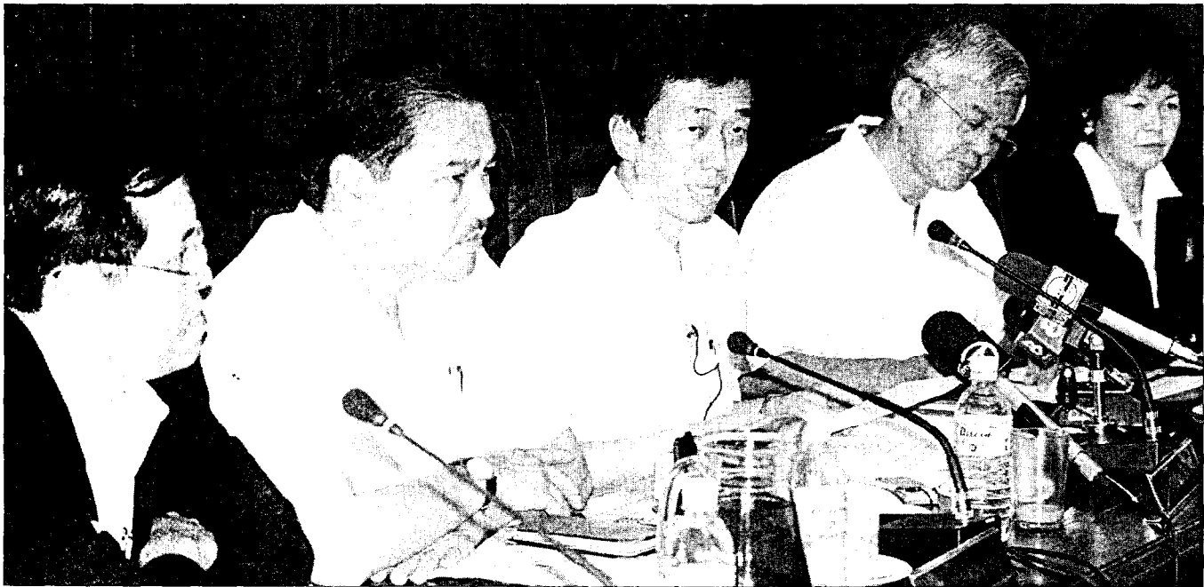
Barisan baru MCA dari kiri, Ketua Pemuda, Ong Tee Kiat, Timbalan Presiden, Chan Kong Choy, Presiden Ong Ka Ting, Setiausaha Agung, Dr. Ting Chew Peh dan Ketua Wanita, Dr. Ng Yen Yen.

Langkah menaikkan Chan Kong Choy kemungkinan mengecewakan penyokong-penyokong Team A yang diketuai oleh Ong Ka Ting yang kini merupakan Presiden MCA