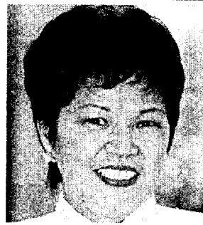
Dr. Ng Yen Yen (Tim. Menteri Kewangan II)