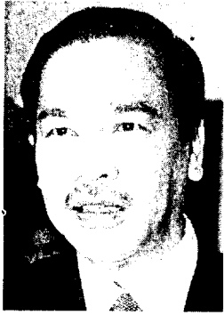
Chan Kong Choy (Menteri Pengangkutan)