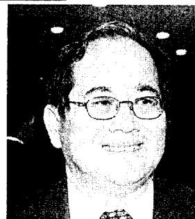
Douglas Uggah Embas (Tim. Menteri Pengangkutan)