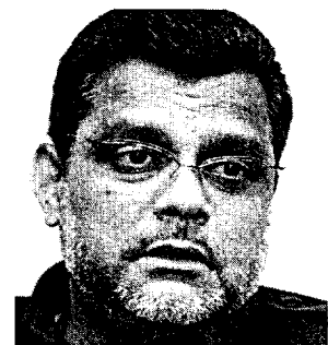
M. Kayveas (Tim. Menteri di Jabatan Perdana Menteri)

thir telah meningkatkan imej dan martabat kaum wanita di negara ini. Banyak pendekatan telah diambil.