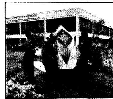
UPACARA pembukaan rasmi kilang kereta Nasional dan upacara pelancaran Proton Saga oleh Dr. Mahathir, Perdana Menteri Malaysia pada 9 Julai 1985.

Dr. Mahathir mendapati cerdik pandai masih menggunakan teori-teori lapuk. Masalah-masalah pembangunan dalam abad-abad kesem-