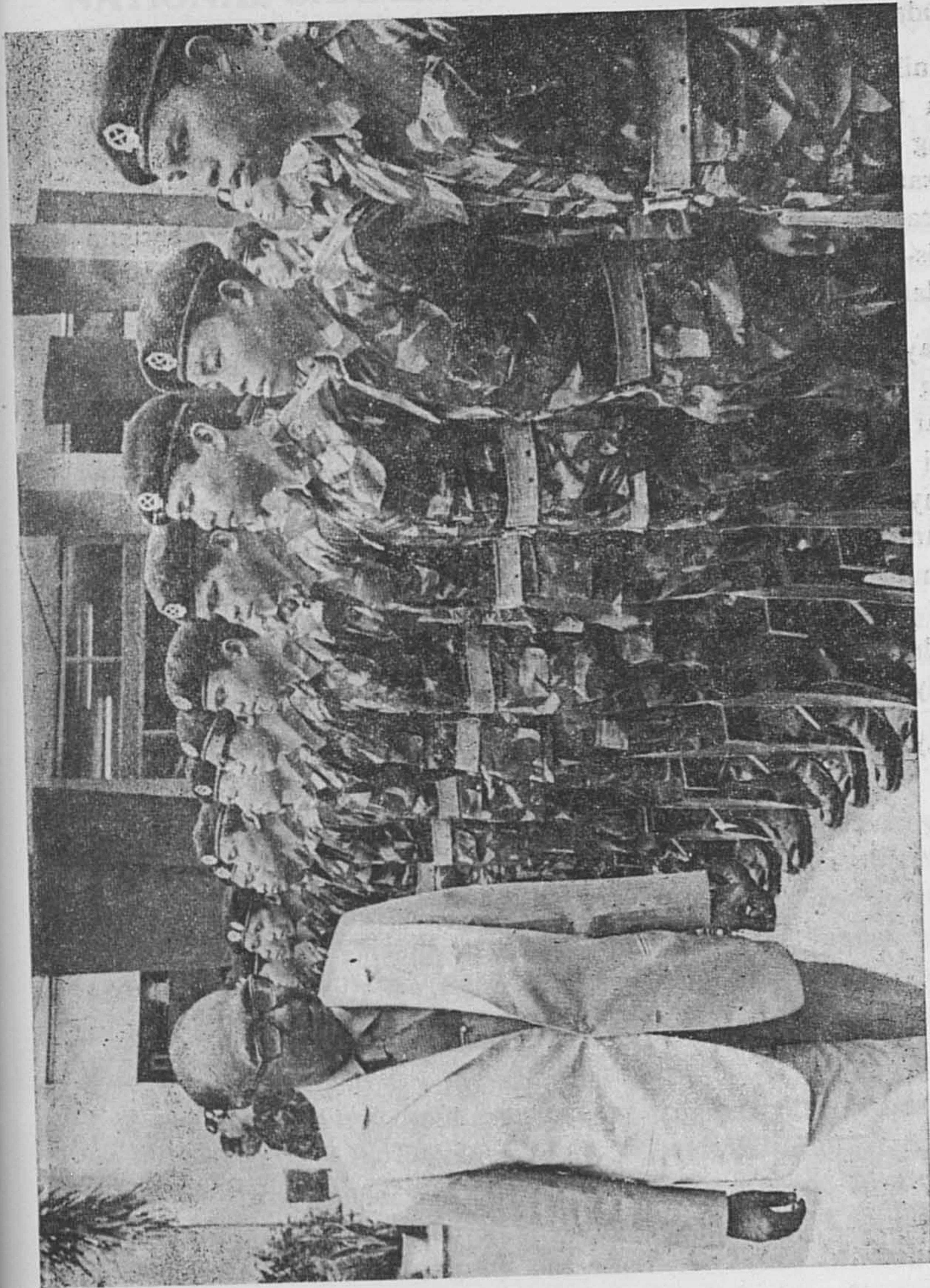
Tun Abdul Razak bin Hussein kelihatan sedang memeriksa barisan penghormatan oleh enam puluh orang Askar Wataniah pelajar-pelajar dan kakitangan Institut Teknologi MARA di Petaling Jaya pada 10hb Januari, 1972.