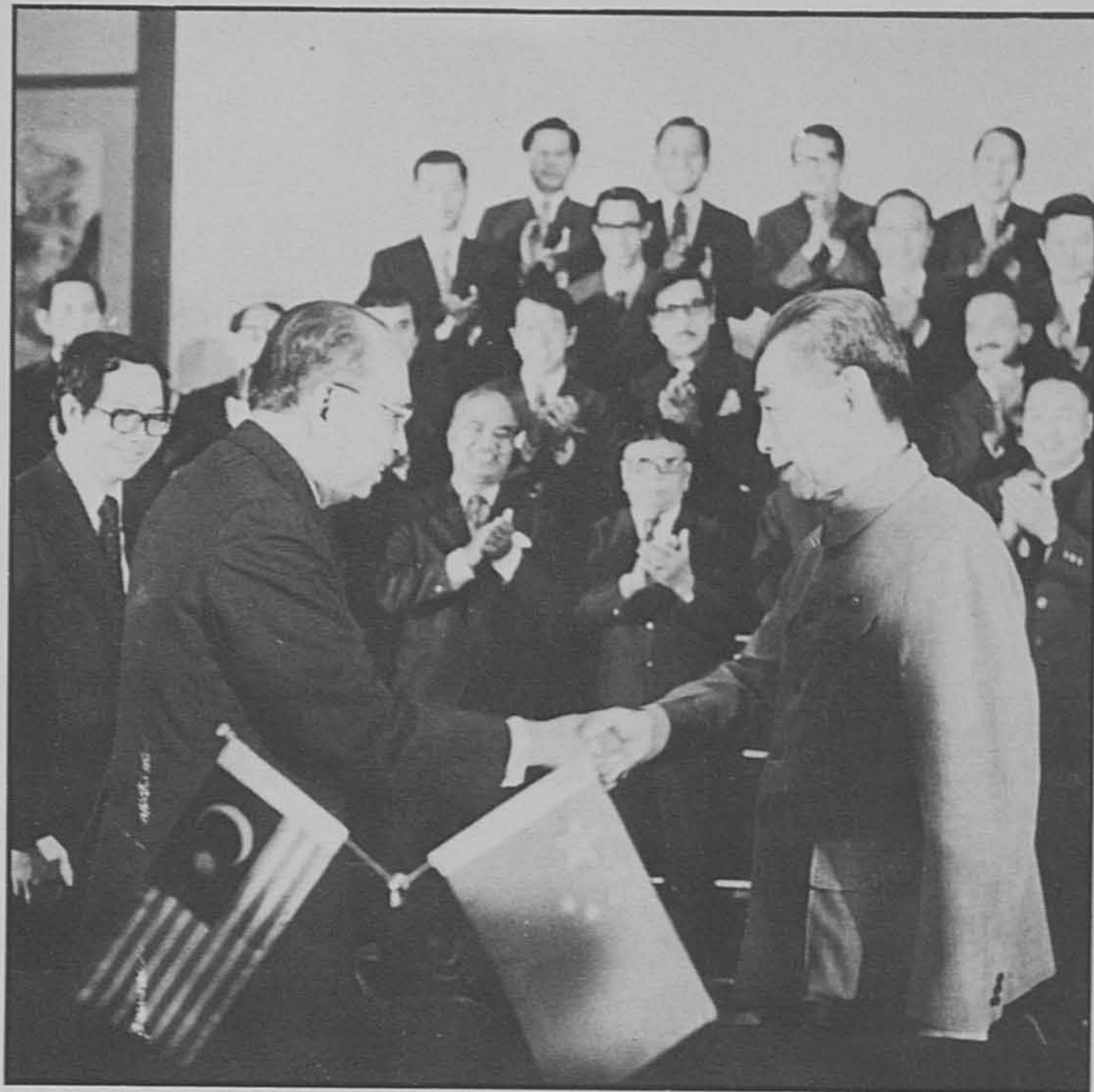
Tun Abdul Razak dan Perdana Menteri Chou berjabat tangan selepas menandatangani Kenyataan Bersama yang merasmikan penubuhan hubungan diplomatik sepenuhnya antara Malaysia dan China di Dewan Besar Rakyat di Peking.

menerus di atas dasar lima prinsip hidup bersama dengan aman damai. Rakyat kedua-dua negara kita pastilah akan bersahabat terus turun-temurun.