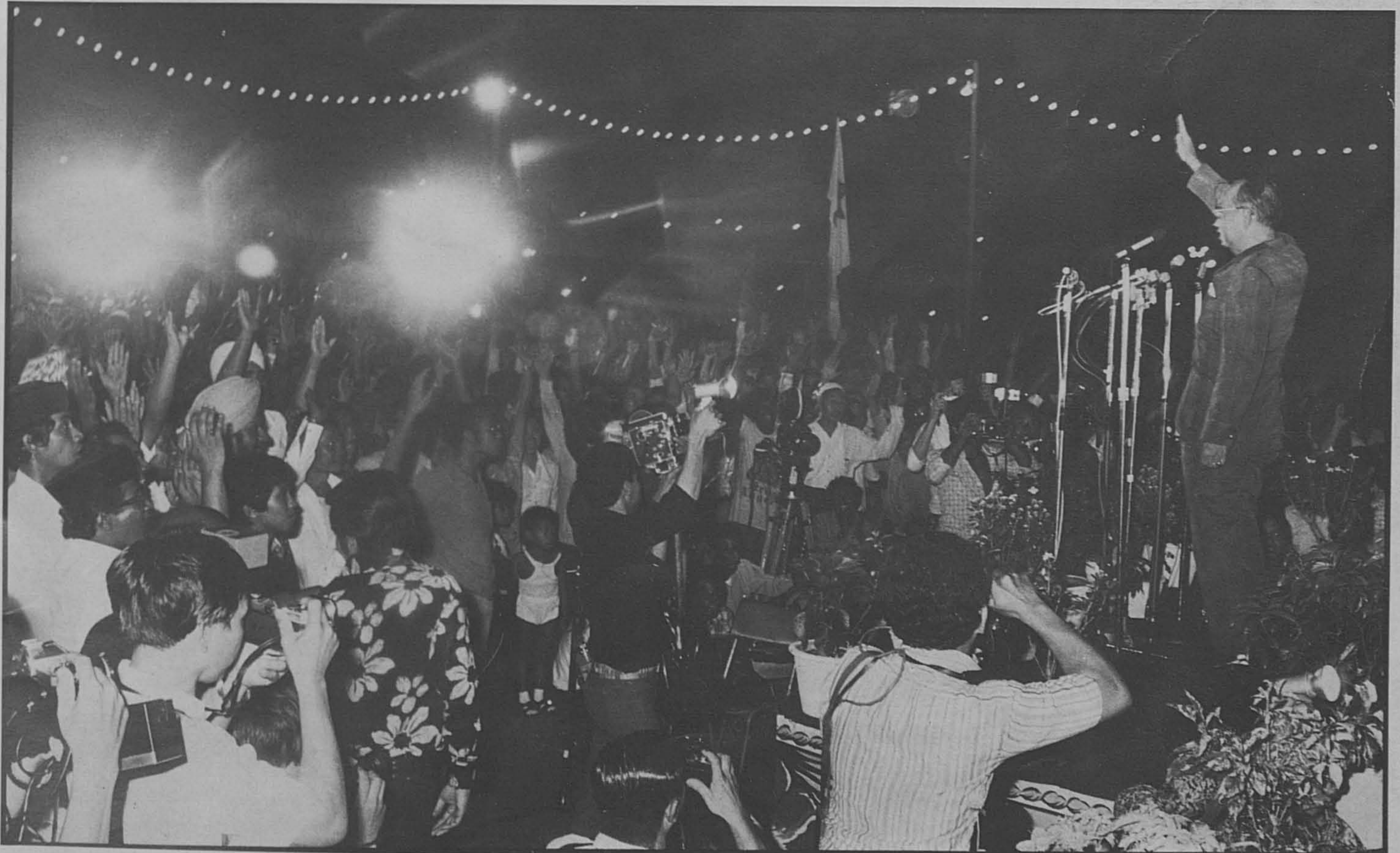
Atas: Tun Razak berucap kepada lebih 50,000 orang dalam rapat raksaksa Barisan Nasional di padang Kuala Lumpur. Bawah: Teriakan 'Berjaya' dari mereka yang hadir.