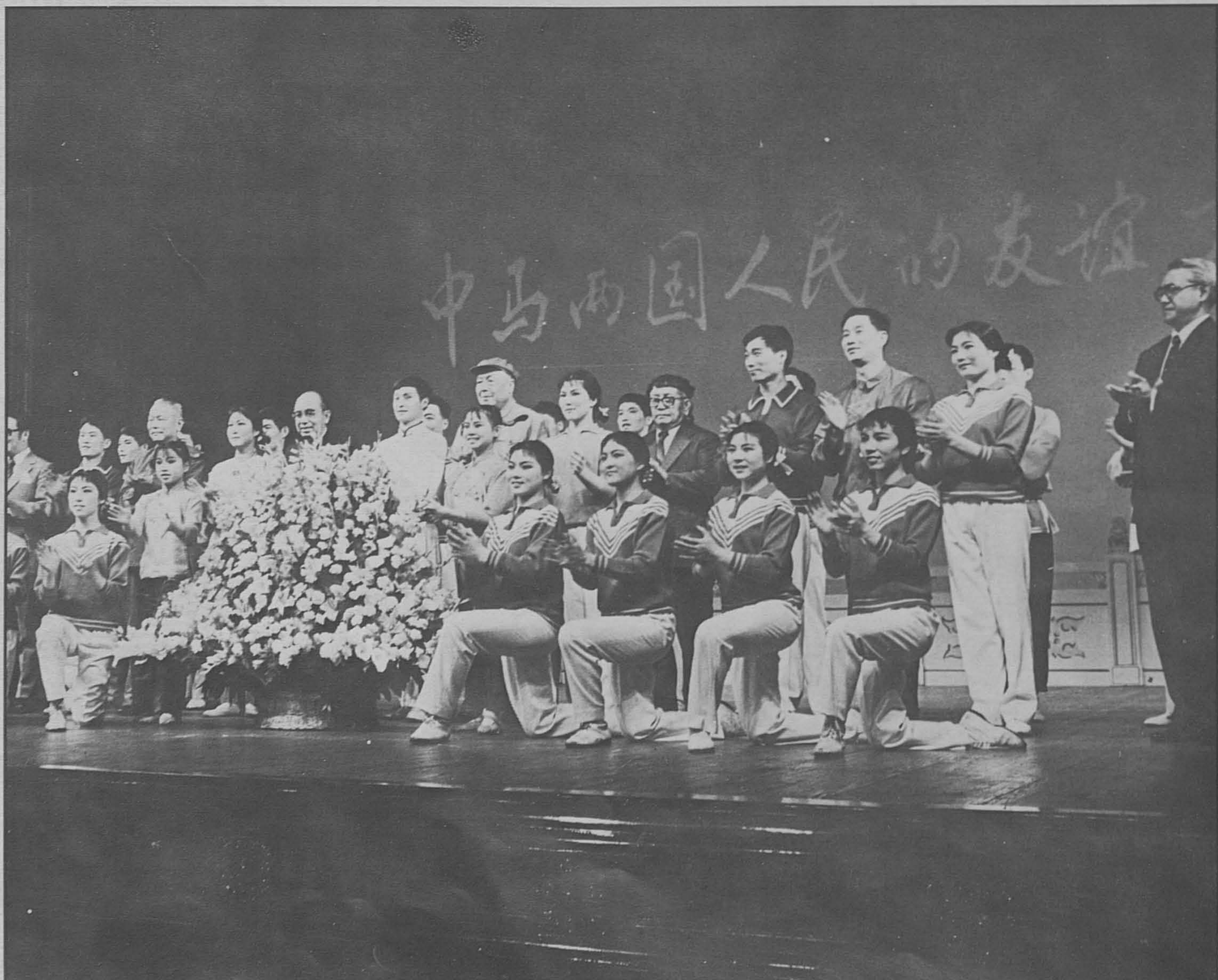
Bawah: Bergambar dengan anggota-anggota kumpulan kebudayaan yang diselenggarakan oleh Biro Kebudayaan Shanghai dalam majlis pertunjukan kebudayaan untuk meraikan Tun Razak di Shanghai.