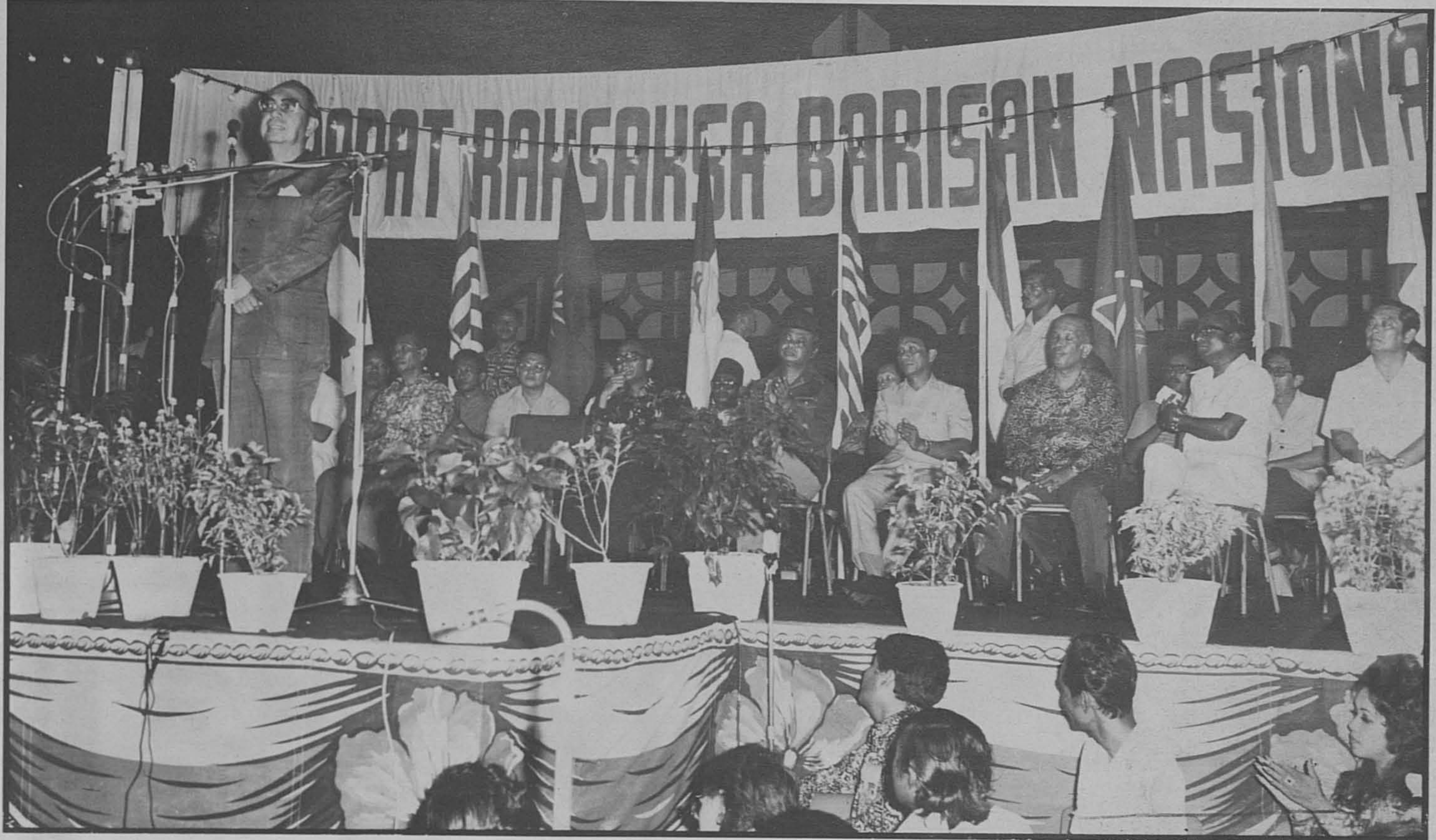
'Nama Malaysia menjadi harum di seluruh dunia dan keharuman itu tidak pernah mencapai ke peringkat tinggi seperti yang ada sekarang', kata Perdana Menteri kita sekembalinya dari China.