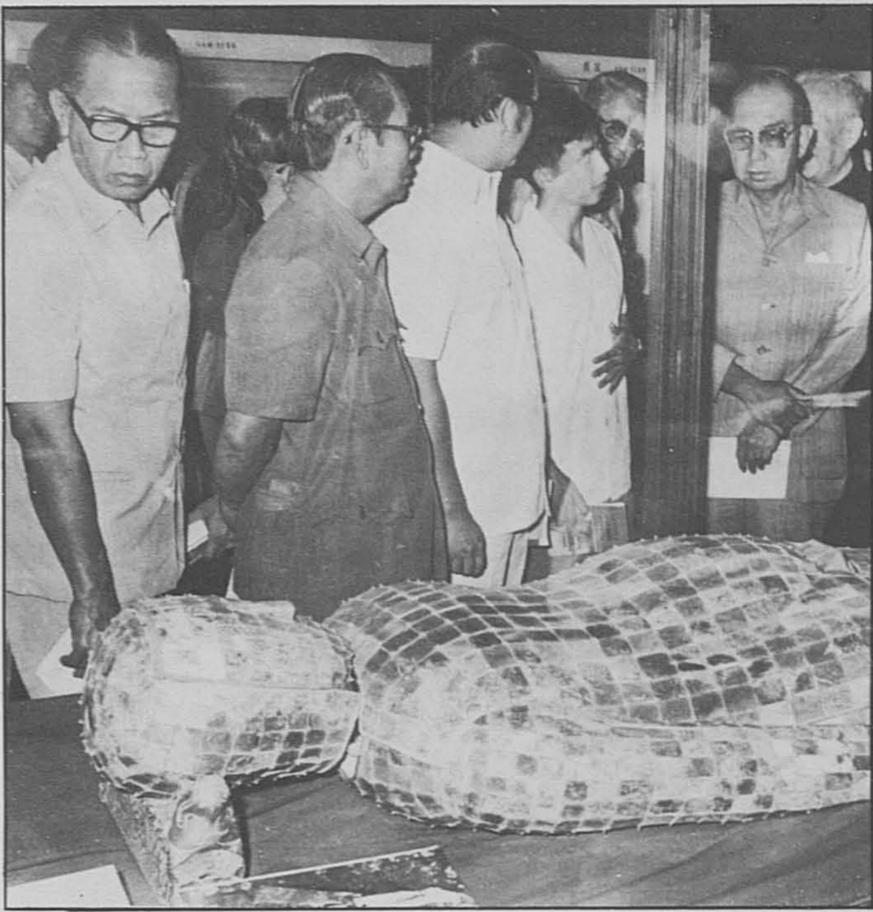
Tun Razak dan beberapa orang anggota perwakilan Malaysia sedang melihat pakaian yang dibuat dari batu jade disulam dengan benang emas yang digunakan dalam pengebumian Putera Liu Sheng 2,000 tahun lalu. Ini adalah salah satu bahan yang paling menarik dipamerkan di Muzium Istana, Peking.

Perdana Menteri, Tun Abdul Razak, kelihatan berjalan di dalam kawasan Muzium Istana yang dahulunya merupakan istana diraja bagi keturunan Ming dan Ching. Tempat ini juga biasanya dikenali sebagai Kota Larangan.