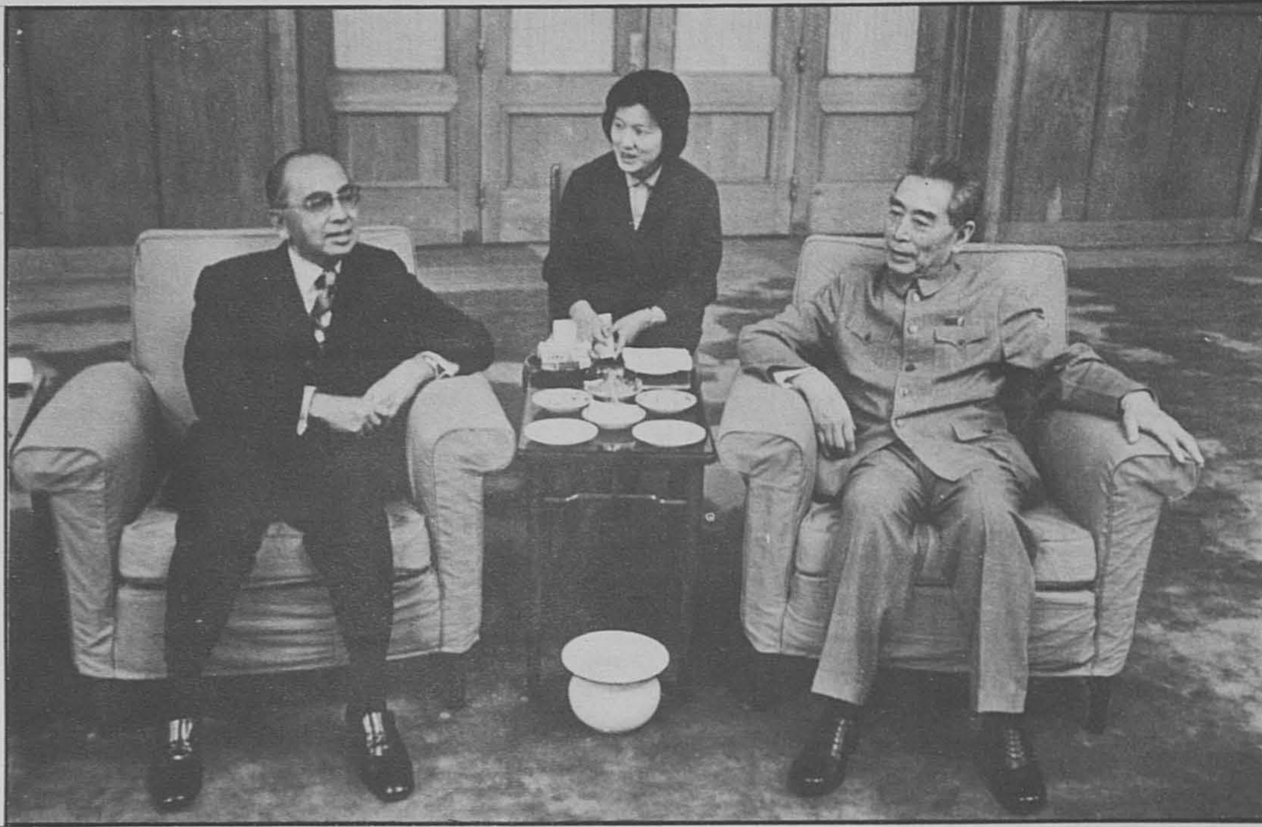
Tun Abdul Razak dan Tuan Chou En-lai bertemu di Dewan Besar Rakyat sebelum Majlis Jamuan Makan yang diberikan untuk menghormati Tun Razak.

Peking ini untuk memulakan babak sejarah yang baharu, menempa tali perhubungan persahabatan yang tulin dan berkekalan setelah pengalaman-pengalaman di masa lalu.