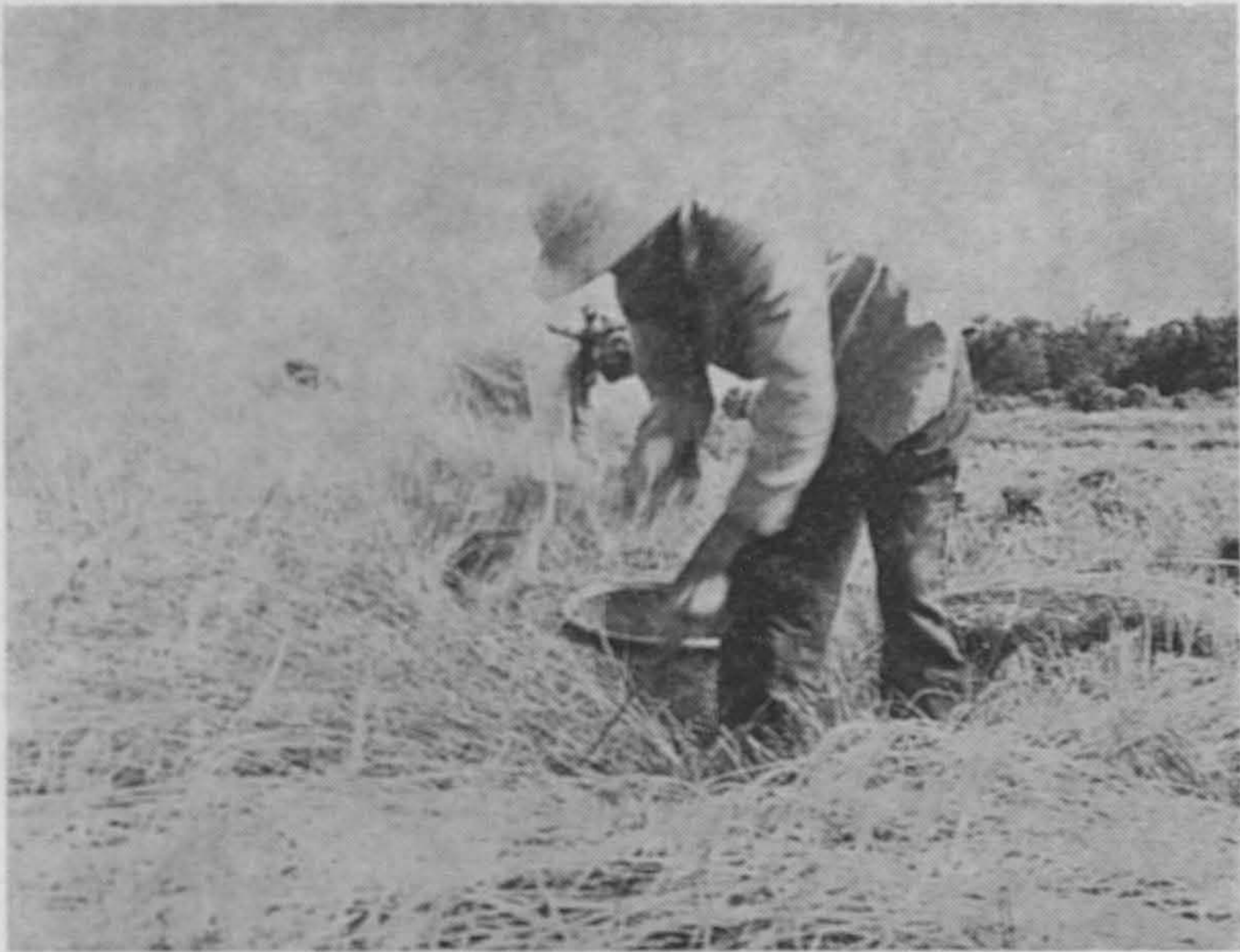
Satu pemandangan petani-petani sedang mengetam hasil padi mereka.

mengurangkan beban rakyat menghadapi inflasi. Kementerian berharap, melalui rancangan ini lebih banyak lagi bahan-bahan makanan dikeluarkan untuk keperluan rakyat.