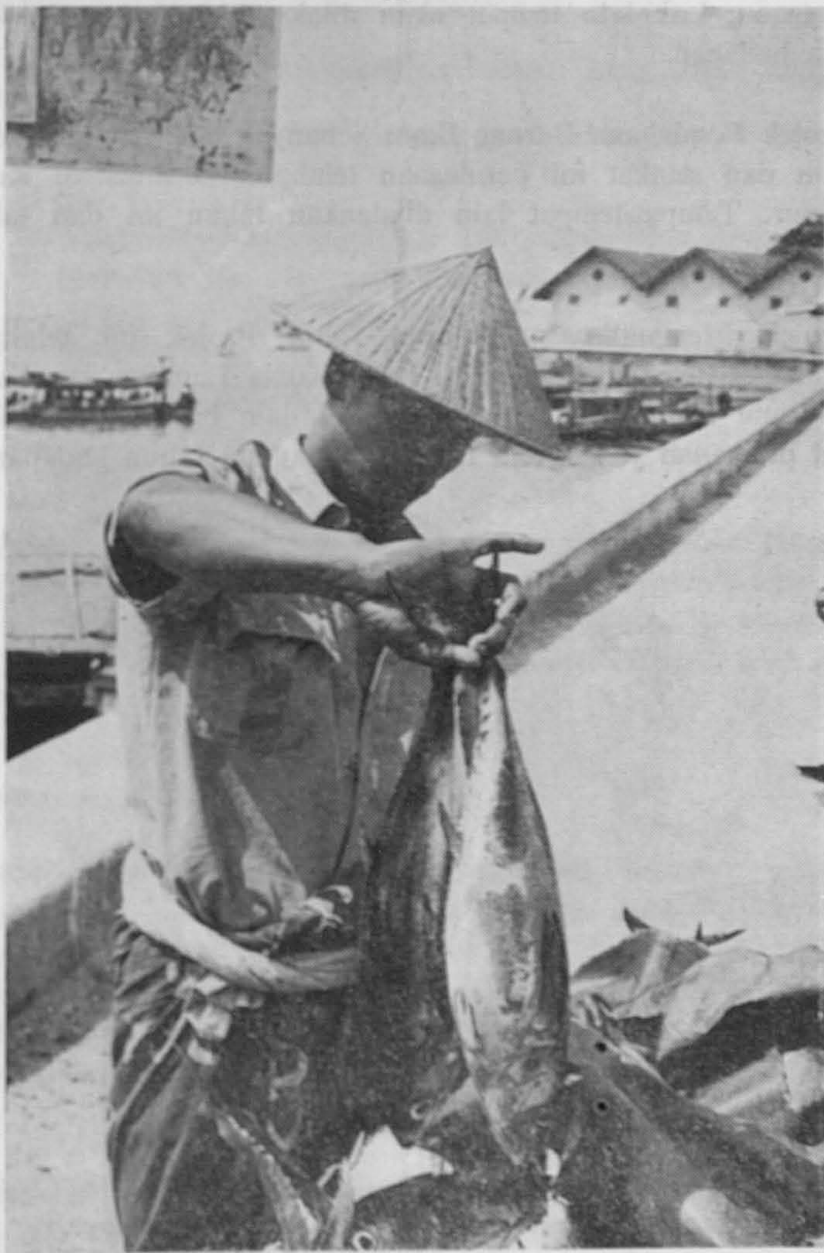
Hasil tangkapan nelayan yang menjadi punca protin utama di negara ini.

Kilang Memproses Udang/Ikan: Tiga buah kilang akan didirikan iaitu di Kuala Kedah, Kuala Trengganu dan Johor Bahru. Pembinaan di Kuala Kedah dan Kuala Trengganu sedang berjalan. Kilang di Kuala Kedah dijangka mula bergerak dalam bulan Ogos manakala di Kuala Trengganu pada bulan Oktober. Peruntukan ialah 1.2 juta ringgit.