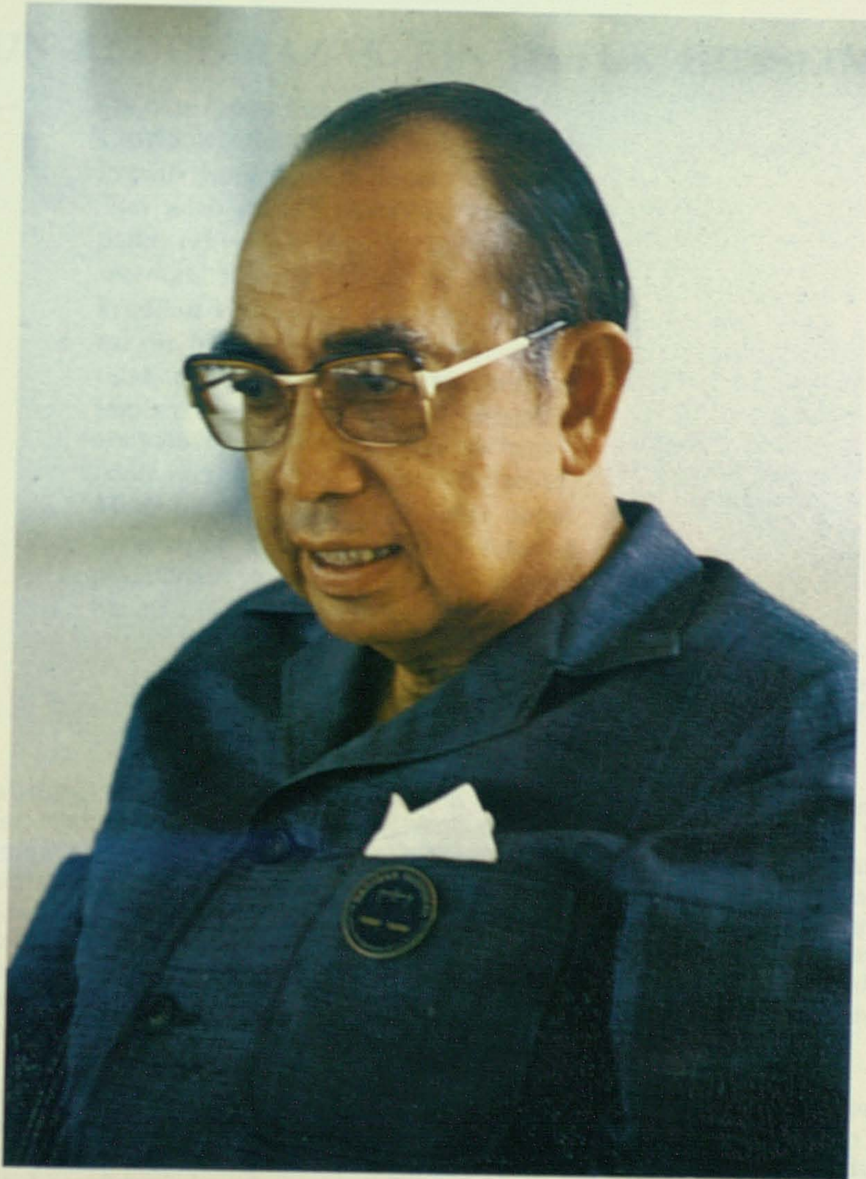
Tun Haji Abdul Razak bin Datuk Hussein, D.M.N., S.M.N., D.P.M.B., S.P.M.K., S.P.M.J., S.P.M.P., S.P.M.T., O.K.I.S., S.P.M.S., S.I.M.P., D.K., S.P.D.K., K.O.M., Perdana Menteri Malaysia 1970-1976