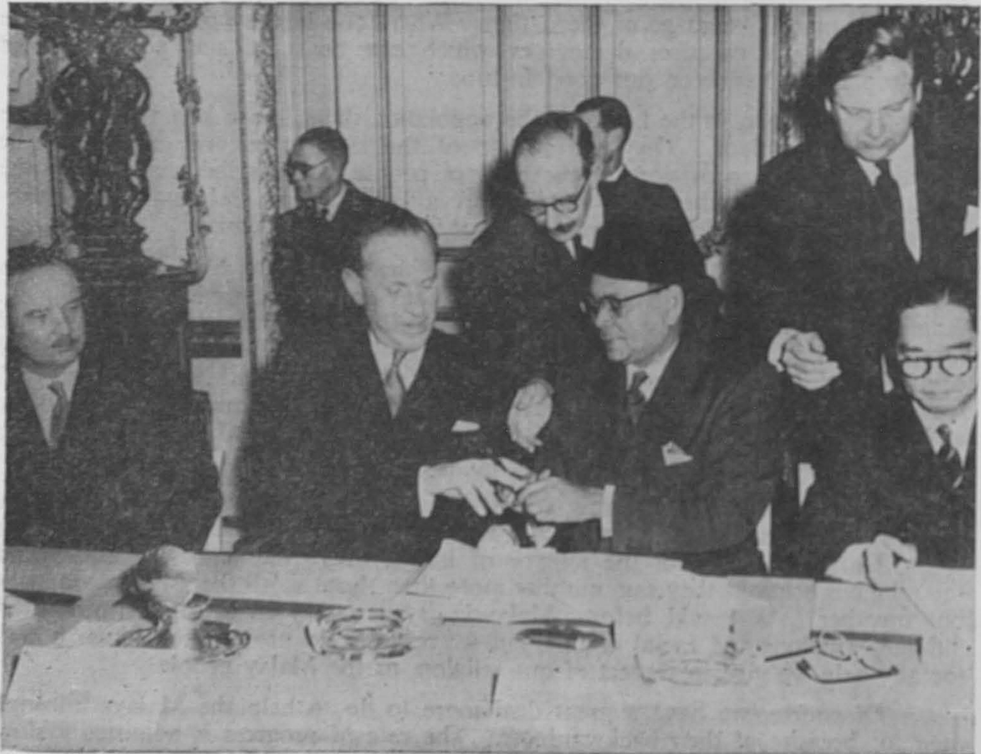
Signing Independent Agreement between Malaya and Great Britain in London in 1956.

We in UMNO have so far co-operated very well with everybody, whether it be from the top or from the bottom, or among the young people and because of this co-operation UMNO continues to be strong as a political party. Many UMNO members of the Cabinet had been with me from the beginning of our struggle. Some have left because of old age, and others have passed away. All these people have given great service to the Party, their race and country. Among these Ministers there was only one who was different and it was necessary to expel him from the party because of his disloyalty. Of course in a big political party like ours we must expect some disloyal elements from within the party. But God is great and by His Grace we won new friends from East Malaysia, whose strength had given the Alliance another victory with which we are able to run the country with a good majority.