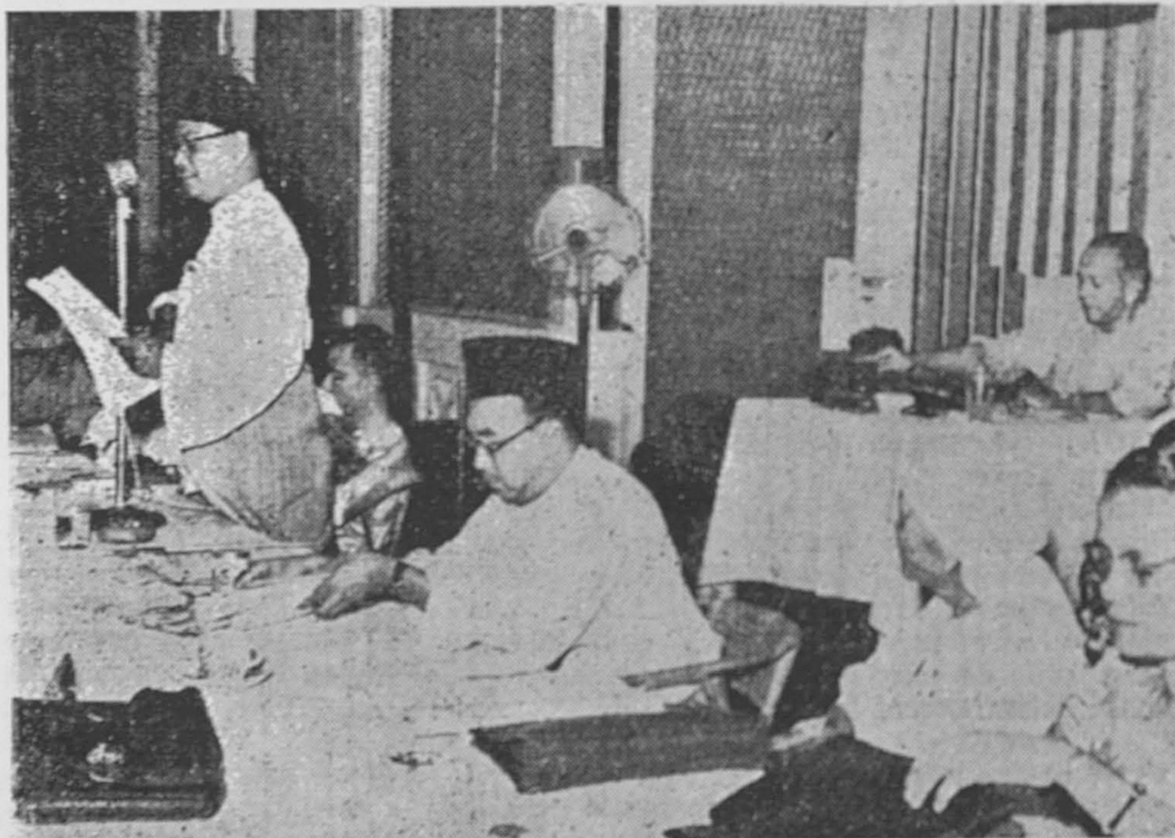
Kelihatan dalam gambar ini, Y.T.M. Tunku beruchap buat kali pertama sa-bagai pemimpin UMNO.

31 Bagi pehak saya tidak dapat saya gambarkan betapa besar-nya rasa terharu dan sedih meninggalkan saudara2 saperjuangan sakalian. Dalam masa 20 tahun