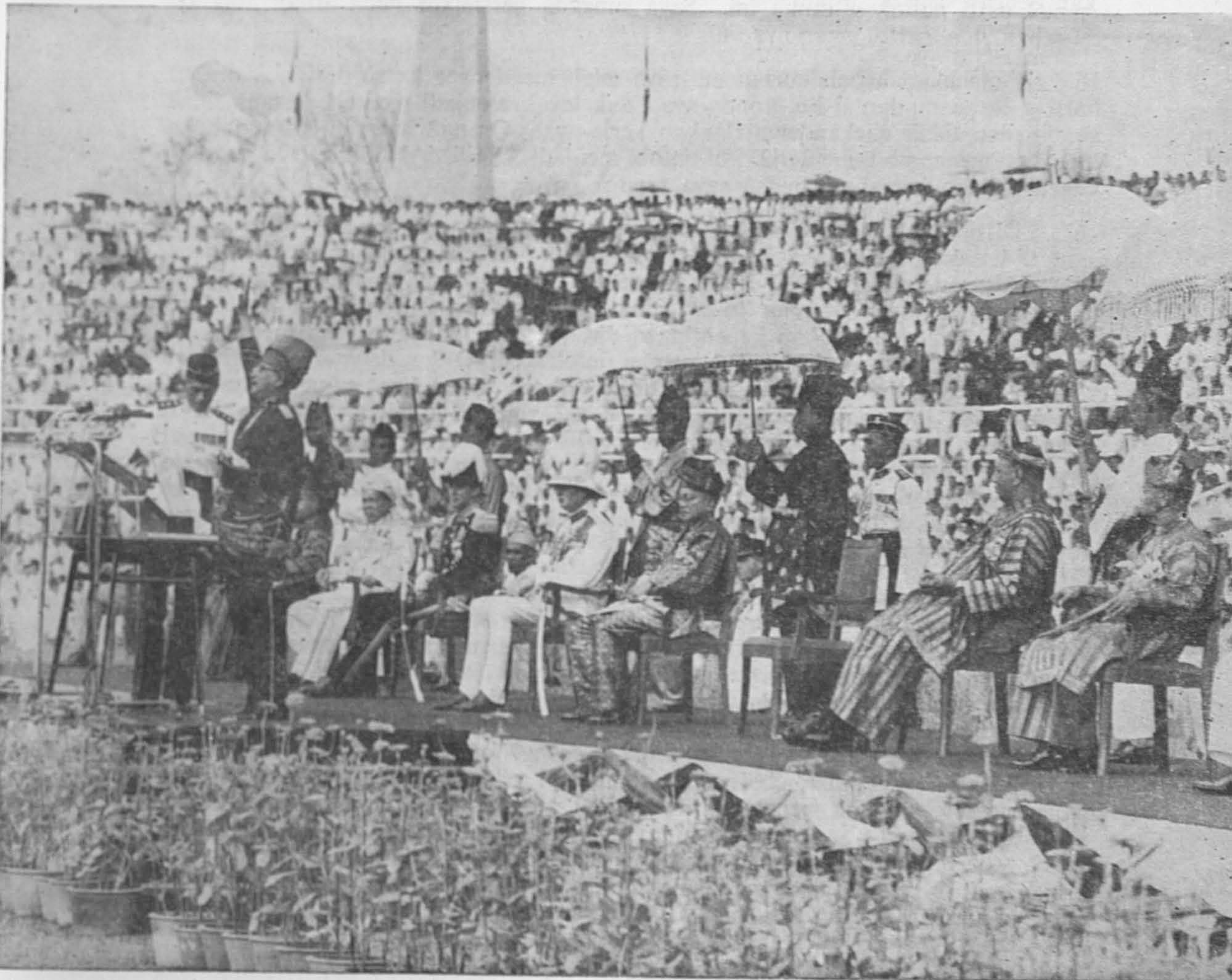
Kelihatan Y.T.M. Tunku Abdul Rahman mengistiharkan Kemerdekaan Persekutuan Tanah Melayu pada 31 haribulan Ogos, 1957.

13. Ahli2 UMNO yang bersama saya dalam kabinet, ada-lah ahli2 UMNO yang asal, yang berjuang sejak daripada mula lagi. Ada di-antara mereka yang telah berpisah dan berhenti daripada kabinet kerana umur-nya sudah tua dan ada pula kerana meninggal dunia. Semua mereka ini ahli2 perjuangan yang banyak jasa-nya kepada parti, bangsa dan negara. Di-antara menteri2 yang bersama saya, hanya ada sa-orang sahaja pembelot, dan dengan serta merta dia di-pechat...Di-dalam itu ada juga antara ahli2 yang belot, tetapi memang-lah bagi sa-buah parti yang besar tidak terlepas daripada anasir2 musuh dalam selimut ini. Allah juga berkuasa dan dengan rahmat dan rahim-Nya telah di-masokkan dengan kekuatan sahabat2 kita dari Malaysia Timor yang mana