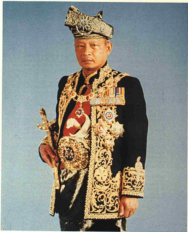
KEBAWAH DULI YANG MAHA MULIA SERI PADUKA BAGINDA YANG DI-PERTUAN AGONG