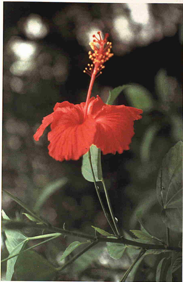
Bunga Raya (Hibiscus)