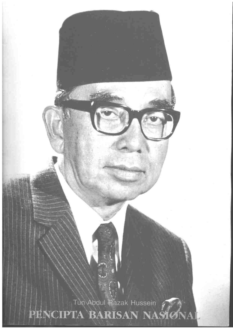
Tun Abdul Razak Hussein