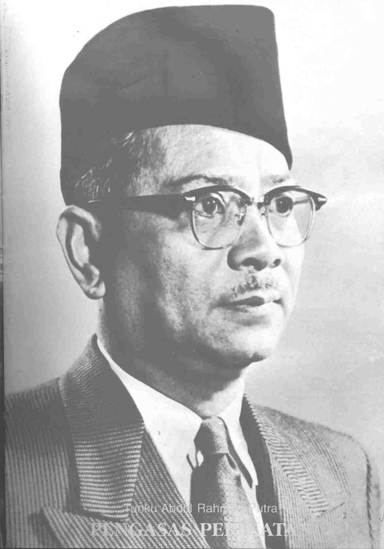
Tunku Abdul Rahman Putra