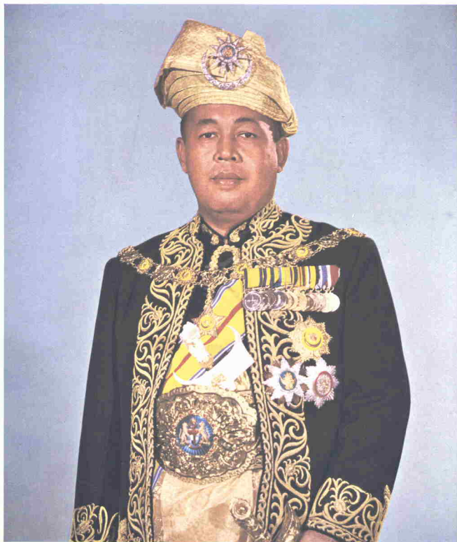
DULI YANG MAHA MULIA SERI PADUKA BAGINDA YANG DI-PERTUAN AGONG HIS MAJESTY THE YANG DI-PERTUAN AGONG