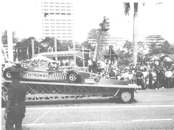
Setelah 40 tahun mencapai kemerdekaan, kejayaan demi kejayaan banyak dicapai.

Walaupun ada yang menafikan kebolehan Malaysia untuk membina sebuah negara maju. Namun suara-suara sumbang itu tidak pernah diperdulikan oleh pemimpin-pemimpin negara. Suara itu dianggap sebagai cabaran yang mesti ditempo