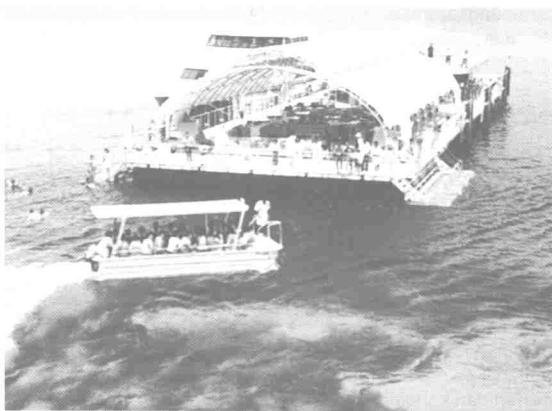
Keindahan Pulau Langkawi menarik ramai pelancong asing.

Ramai yang menolak kemungkinan Pulau Langkawi yang mundur dari pelbagai aspek akan maju seperti pulau-pulau lain. Tetapi pihak yang berinovasi tinggi melihatnya daripada satu sudut yang tidak dilihat oleh orang lain. Dengan keyakinan dan kerja kuat juga akhirnya Pulau Langkawi menjadi sebuah pulau bebas cukai.