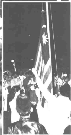
Bendera Persekutuan Tanah Melayu sedang dinaikkan menggantikan Bendera Union Jack pada 31 Ogos 1957.