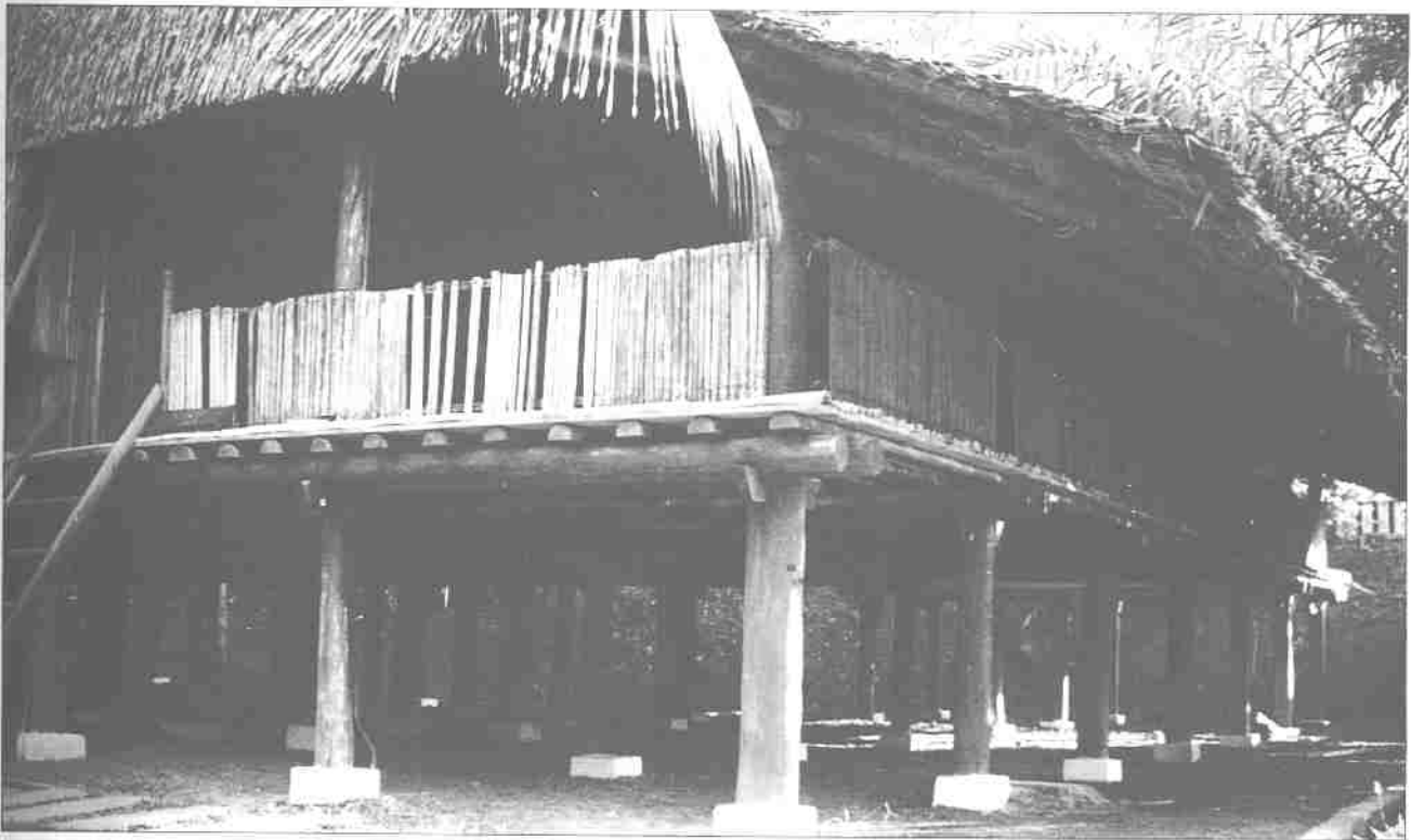
Rumah dusun lutud Sabah

Orang Bajau menetap di pesisiran pantai barat dan timur Sabah terutama di Kota Belud. Mereka berasal daripada Pulau Mindanao dan Sulu, Indonesia dan berhijrah ke Sabah pada abad ke-18. Pekerjaan utama mereka adalah sebagai nelayan dan menternak kuda serta lembu. Mereka merupakan penunggang kuda yang mahir.