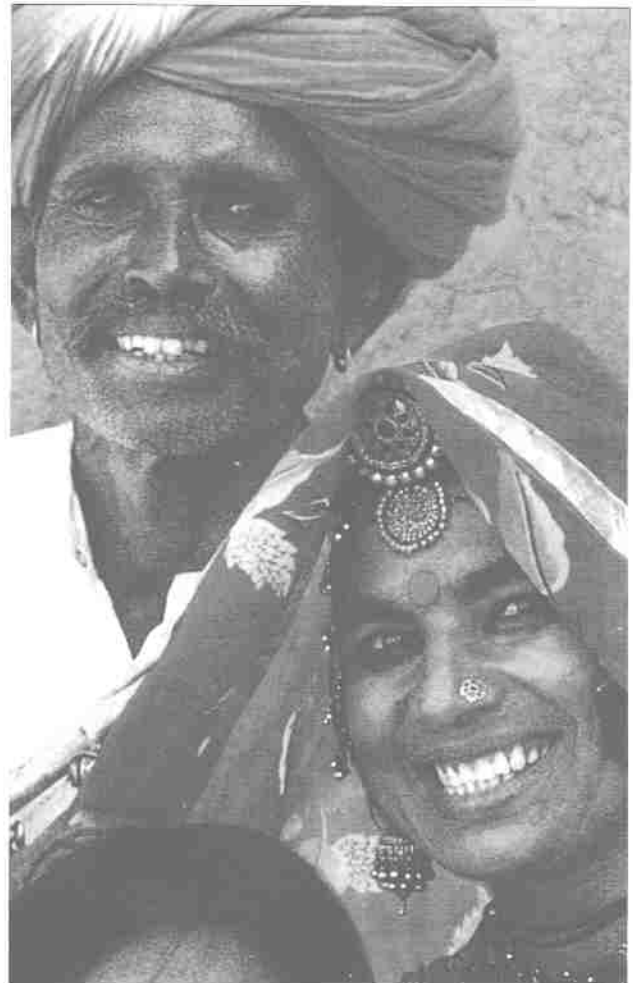
Antara kaum etnik India

Ciri-ciri kebudayaan orang India juga amat unik. Mereka mempercayai wujudnya banyak dewa untuk mentadbir alam. Setiap peristiwa