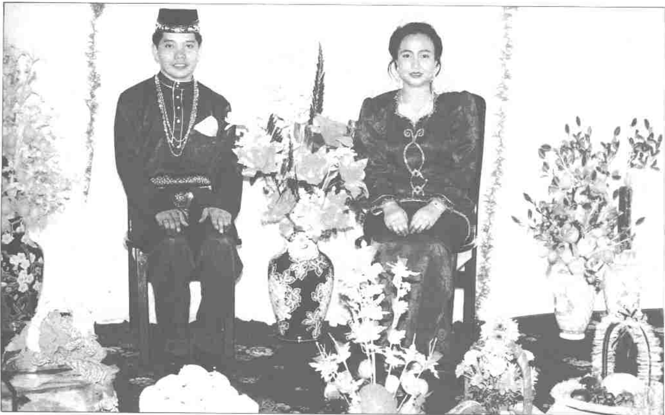
Ciri-ciri budaya yang masih kekal

Selain itu, adat resam ini semakin ditinggalkan oleh orang Melayu yang menerima pengaruh moden. Mereka menjalankan adat resam yang asas sahaja atau secara ala kadar untuk