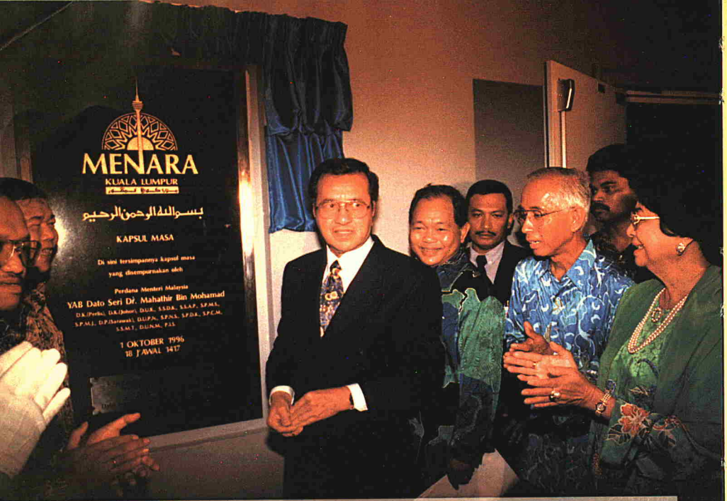
Upacara perasmian KL Tower. The official launching of the KL Tower.