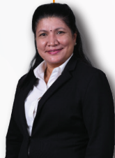
YB TIMBALAN MENTERI PERPADUAN NEGARA YB SENATOR SARASWATHY KANDASAMI