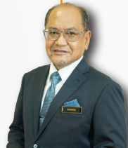
KETUA SETIAUSAHA DATUK SERI HJ. HASNOL ZAM ZAM BIN HJ AHMAD PTD TURUS III