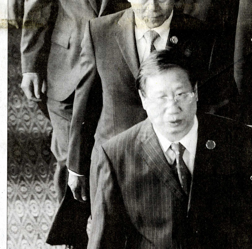
BARISAN pemimpin [depan] Timbalan Perdana Menteri Vietnam Pham Gia Khiem, Menteri Luar Thailand, Kantathi Suphamongkon, Menteri Luar Singapura George Yeo, Menteri Luar Myanmar, U Nyan Win dan Syed Hamid Albar melangkah masuk ke Dewan Plenari untuk Majlis Menandatangani Deklarasi ASEAN-Kanada Mengenai Kerjasama Memerangi Keganasan Antarabangsa sempena Mesyuarat Menteri-Menteri Luar ASEAN Ke-39 di Pusat Konvensyen Kuala Lumpur baru-baru ini.

Penyertaan dalam EAS adalah berdasarkan kriteria ASEAN iaitu: Menandatangani Perjanjian Persahabatan dan Kerjasama (TAC) di Asia Tenggara; rakan dialog penuh ASEAN; dan mempunyai hubungan perdagangan yang besar dengan pertubuhan serantau itu.