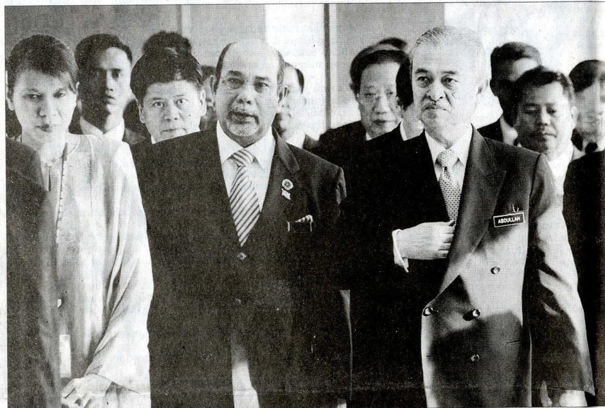
ABDULLAH Ahmad Badawi tiba sambil diiringi Syed Hamid Albar pada majlis perasmian Mesyuarat Menteri-Menteri Luar ASEAN ke-39 di Pusat Konvensyen Kuala Lumpur [KLCC] baru-baru ini.