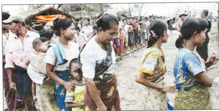
BERATUS-RATUS mangsa Taufan Nargis beratur untuk mendapatkan bantuan makanan di bandar Kyout Tan, kira-kira 32 kilometer dari Yangon.